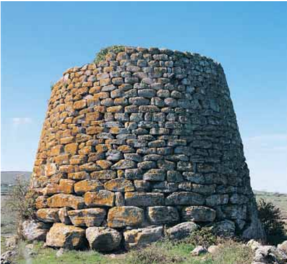
Fig. 120 Macomer, Nuraghe Succuronis: lato NO.

L'ingresso, volto a SE e di luce trapezoidale (alt. m 2,50; largh. m 1,10/0,90), è sormontato da un robusto e ben rifinito architrave (lung. m 1,97; spess. m 0,80) con finestrino di scarico trapezoidale