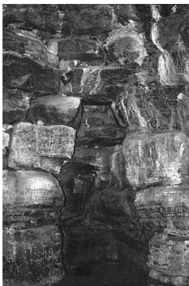
Fig. 123. Macomer, Nuraghe Saccorionis: nicchia della camera centrale.