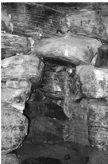
Fig. 122. Macomer, Nuraghe Saccorionis: nicchia della camera centrale.

EEM 1922; p. 129; Elenco del Comune; TARAMELLI 1935, p. 57, n. 39; MELIS 1967, p. 135, n. 47; MORAVETTI 1973; SEQUI 1985, p. 22, scheda n. 9; PITTAU 1985, tavv. 104-105; LILLIU 1988, p. 513; KALBY PIZZOLU 1990, p. 44, n. 57