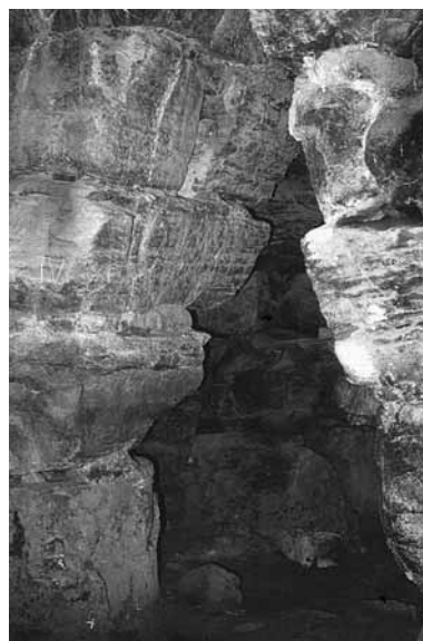
Fig. 124. Macomer, Nuraghe Saccorionis: nicchia della camera centrale.